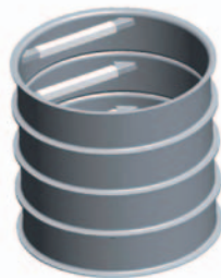
Schachtring mit Steigeisen